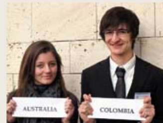
Μαθητές της Σχολής «Πρεσβευτές» στο 10ο Μοντέλο Ηνωμένων Εθνών

Σε μια ακόμη εξέλιξη σχετικά με το Κολλέγιο Περρωτής, ο Δρ. Χρήστος Κοτλιμπίρης (απόφοιτος του Κολλεγίου το 2001), διορίστηκε Βοηθός Καθηγητή Μάνατζμεντ στο αναγνωρισμένου κύρους Πανεπιστήμιο Wageningen στην Ολλανδία.